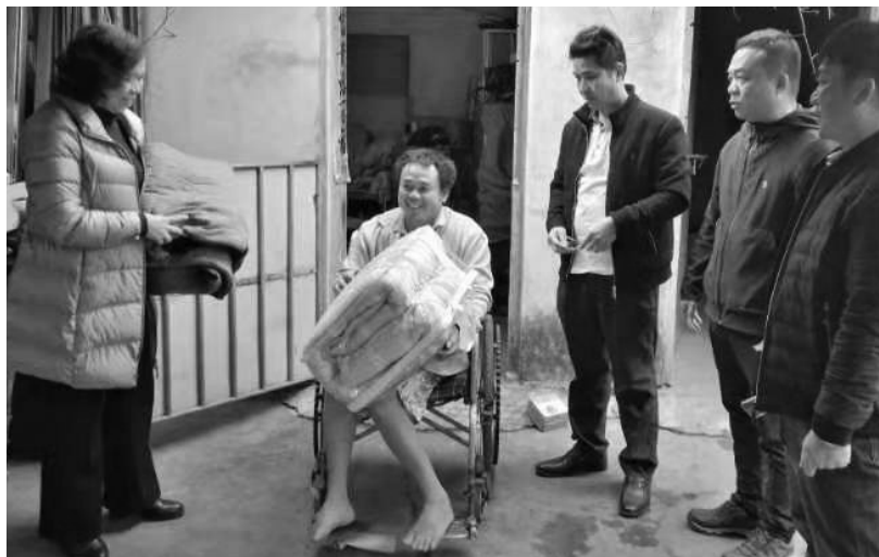
困难群众收到过冬棉被