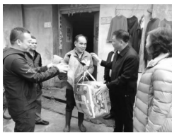
寒冬送棉被