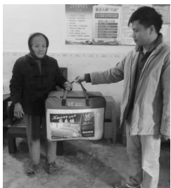
寒冬送棉被